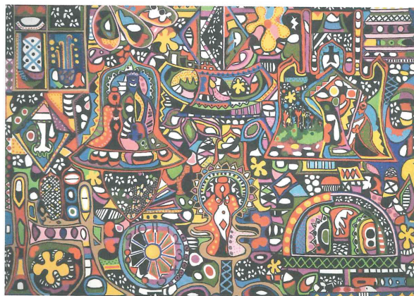
Juwel, 1967, olie på lærred.

Hun udtrykker sig i olie malerier på lærred, i frodige og farverige tegninger på papir og desuden i eksperimenterende hybridformer, hvor hun forbinder de forskellige teknikker hun anvender i en slags installationer hvor billeder, lyd,